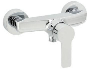
24.132150.1.01 Wannenfüll- / Brausemischer Aufputz exposed bath/shower mixer