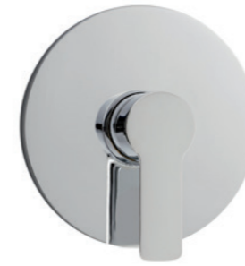
24.130035.1.01 Wannen-/Brausemischer Unterputz Farbset Wandmontage | Blende Ø 150 mm concealed bath/shower mixer final assembly set | cover Ø 150 mm